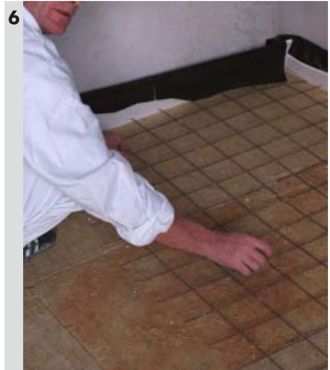
Ułożenie siatki zbrojącej metalowej