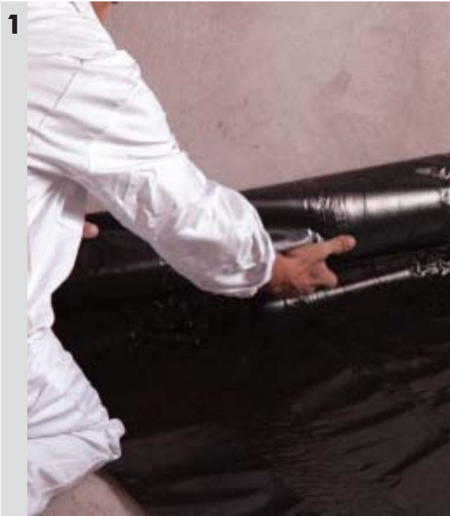
Ułożenie folii hydroizolacyjnej na posadzce