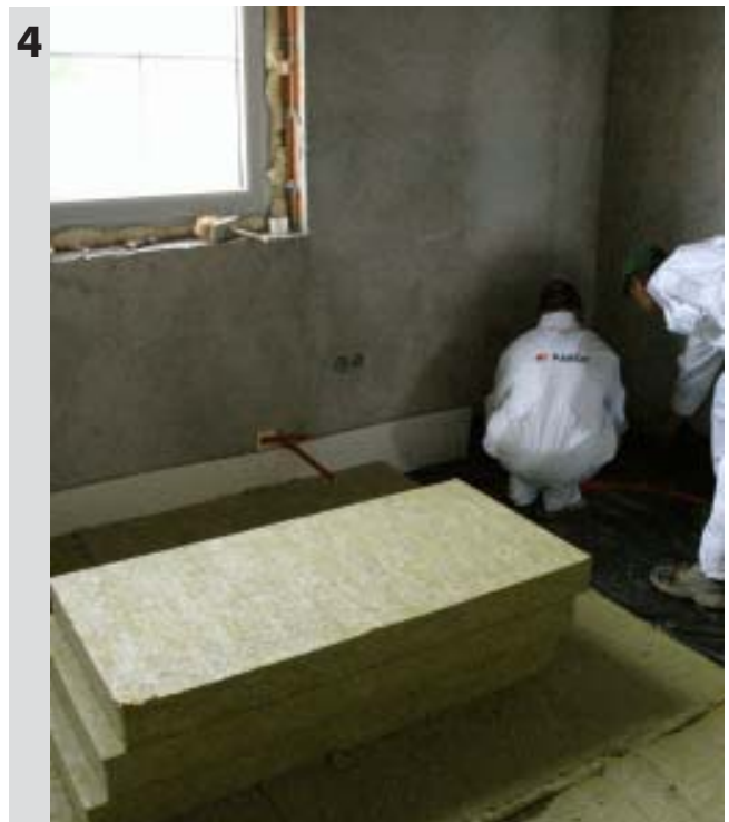
Układanie płyt PAROC SSB 1 i wyprowadzenie instalacji pionowych