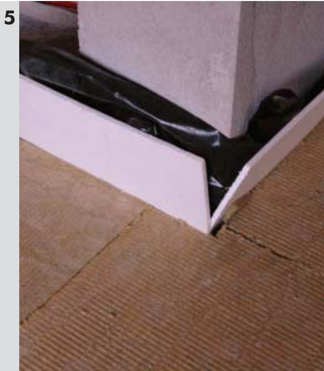
Przy układaniu termoizolacji należy zwrócić uwagę na dylatację wokół ścian zewnętrznych