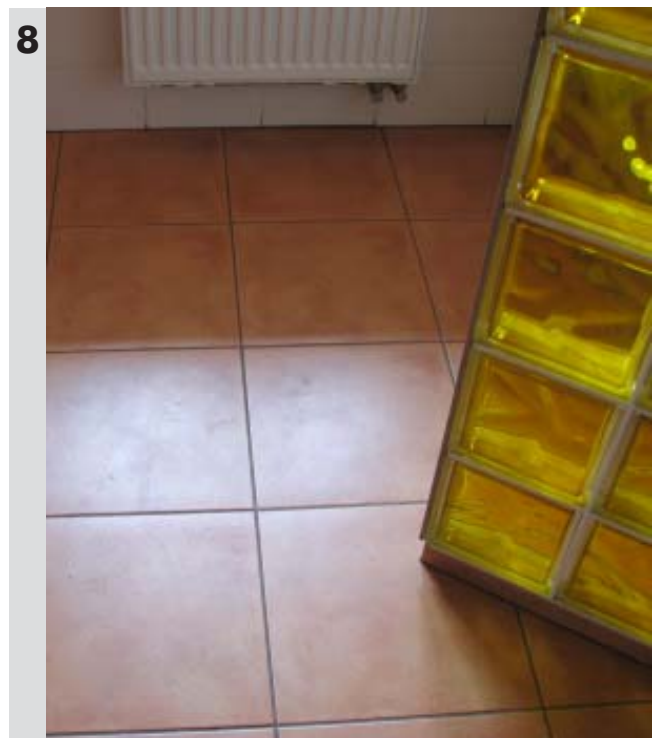
Wylanie posadzki min 5cm i przyklejenie płytek ceramicznych