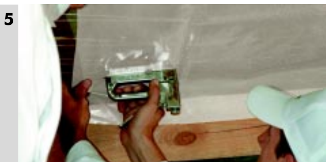
5 Montaż folii paroizolacyjnej do konstrukcji dachu.