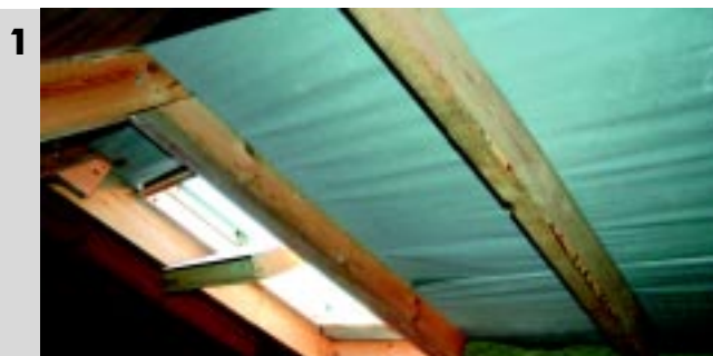
1 Poddasze przed montażem termoizolacji.