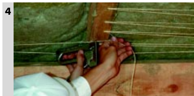
4 Dodatkowe mocowanie termoizolacji Paroc zapobiegające wysuwaniu się płyt termoizolacyjnych za pomocą np. drutu, sznura.