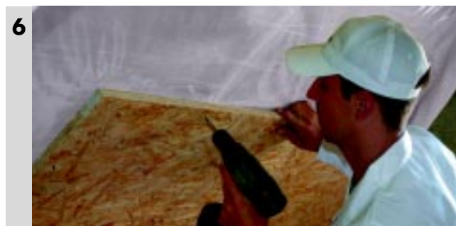
6 Montaż elementu wykończeniowego poddasza np. płyty gipsowo-kartonowe, wiórowe lub panele drewniane.