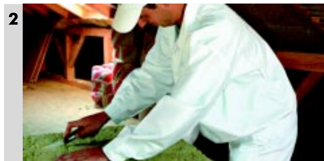
2 Przycinanie do wymiarów termoizolacyjnych płyt z wełny kamiennej Paroc.