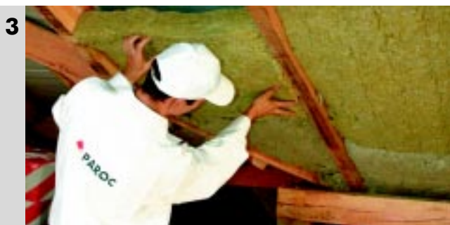
3 Układanie termoizolacji między krokiewmi - pamiętaj o przycięciu płyty tak aby szerokość była większa o 2 cm od rozstawu krokwi, co zapobiega wypadaniu materiału termoizolacyjnego i powstawaniu mostków termicznych.